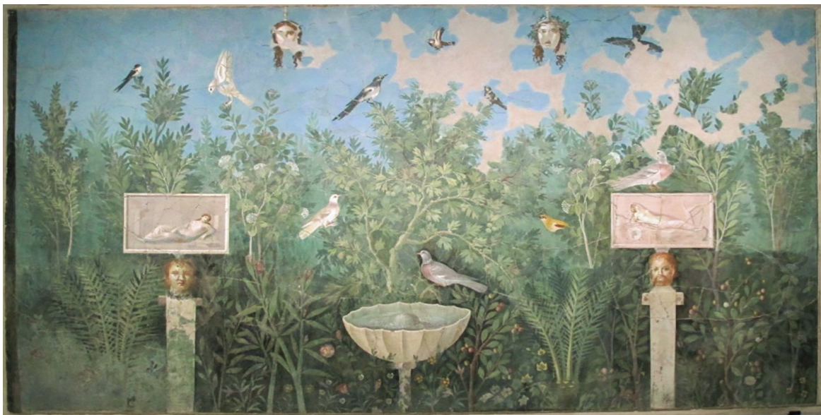
Jardin. Fresque de la Maison du Bracelet d'Or à Pompéi, 30-35 AD