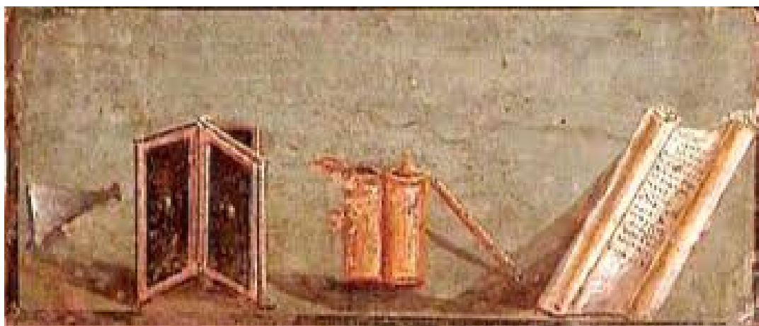
Instrumenta scriptoria , Maison de Julia Felix à Pompéi, Musée archéologique de Naples